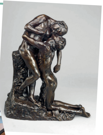
Camille CLAUDEL 8 déc. 1864 - 19 oct. 1943