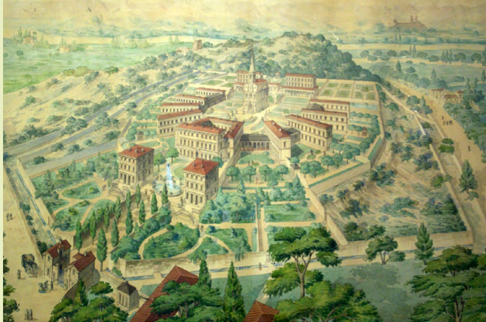
Vue à vol d'oiseau de l'asile de Montdevergues d'après les plans de M. Philippon, M. Joffroy et P. Lenoir, architectes de cet asile

Aussi une réflexion globale et prospective sur son devenir est indispensable, afin d'accompagner son évolution et de pérenniser cet héritage. Il s'agit également de mieux faire découvrir et apprécier par tous ce patrimoine naturel exceptionnel.