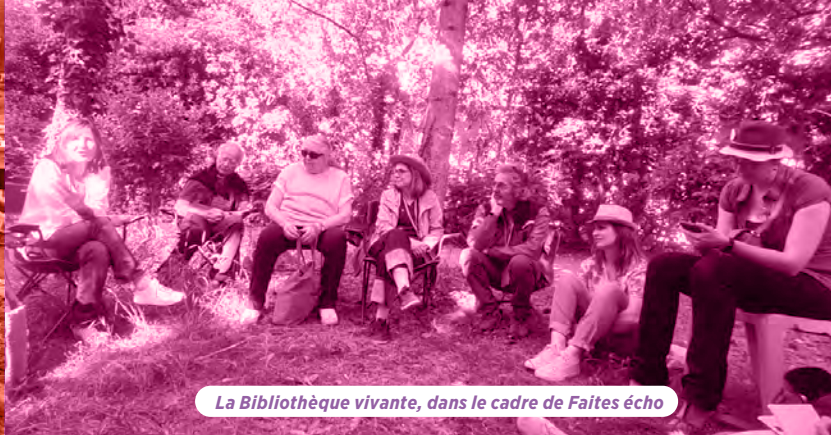
La Bibliothèque vivante, dans le cadre de Faites écho

«L'ambition est claire: faire émerger un projet départemental cohérent, lisible et mobilisateur. Affirmer que la santé mentale doit être une priorité publique, un enjeu citoyen, et un domaine dans lequel l'innovation territoriale est non seulement possible, mais indispensable.»