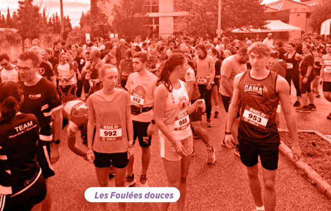
Les Foulées douces